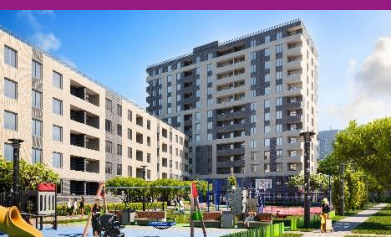
«Квартал на Московском»