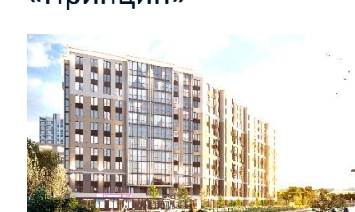
«Дом на Васильевском»