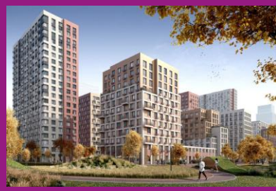
«Европейский берег 2.0»